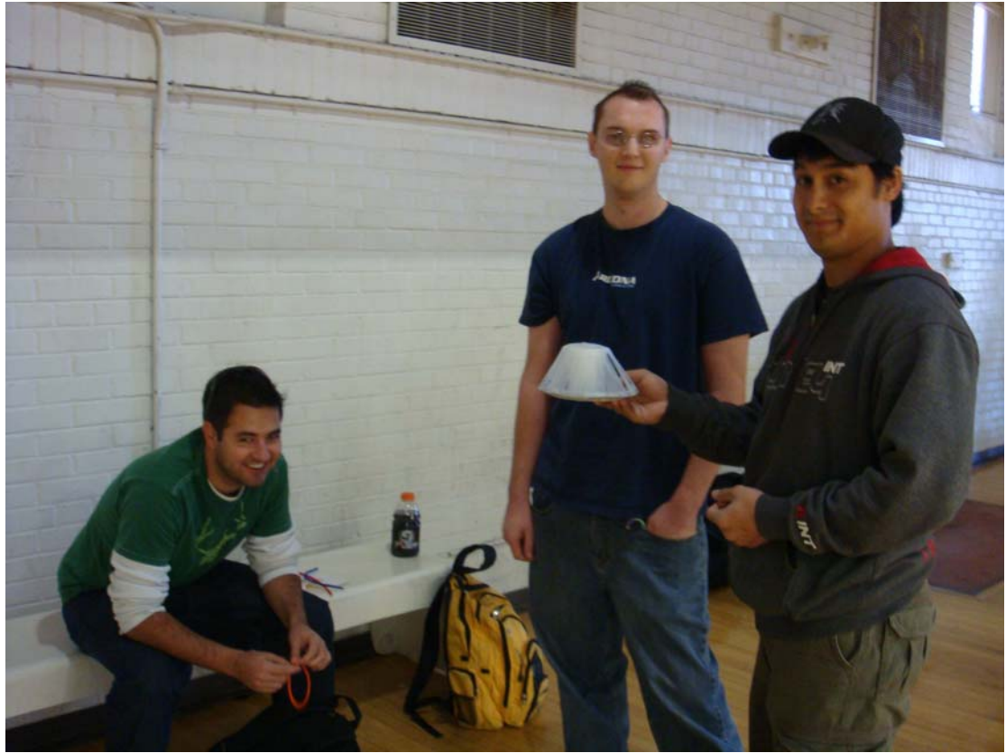
上課分組的隊員<製作小道具>